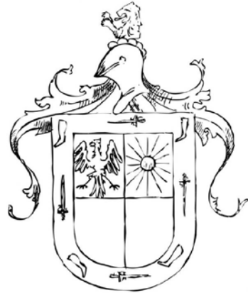
Figura II. Escudo de Francisco Verdugo. Tomado de La nobleza indígena del centro de México después de la conquista .

Con el incremento de funcionarios españoles en la administración novohispana, estas prerrogativas también fueron anuladas. 64 Las concesiones de escudos de armas a los caciques prácticamente desaparecieron para principios del xvii. Sumado a esto, cuando Ana Cortés Ixtlilxóchitl (esposa de Verdugo) quedó a la cabeza del cacicazgo (1563), las funciones de gobierno fueron definitivamente retiradas. 65 No obstante, donde se manifiesta con mayor nitidez el proceso de pérdida de privilegios, es en el tributo. Ya vimos lo copioso que fue para Verdugo. Pero, posteriormente, el virrey Gastón de Peralta (1510-1587) ordenó que el pago anual para Ana Cortés fuera de 60 gallinas, una