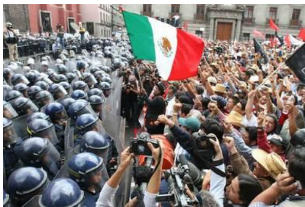
Fotografía de portada del periódico La Jornada , 28 de marzo de 2007. Manifestación en contra de la reforma a la LISSSTE detenida por el aparato policiaco.

Para puntualizar, desde la legislación de seguridad social, se entiende por cesantía cuando el trabajador cumple sesenta años, y por vejez a partir de los sesenta y cinco, mientras que, el retiro es cuando el trabajador desea retirarse sin tener como requisito una edad mínima, pero tendrá que contar con los recursos suficientes en su cuenta individual para obtener una pensión que lo pueda sostener de manera vitalicia.