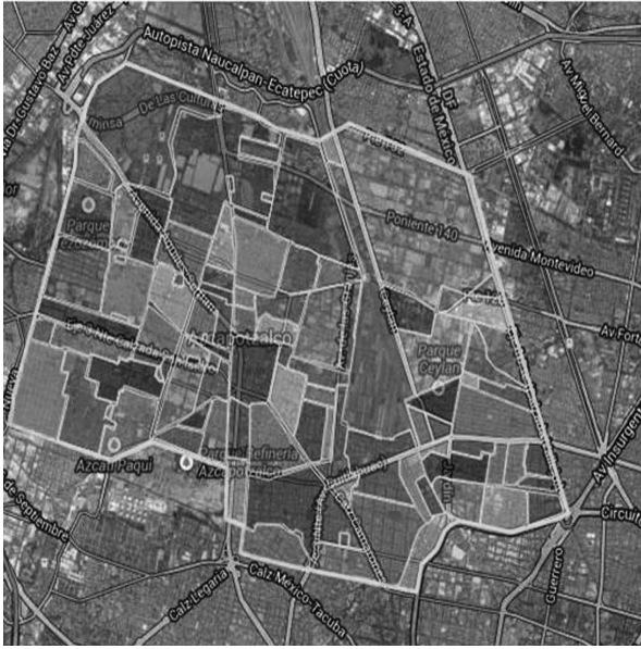
FIGURA2. Los barrios de Azcapotzalco < https://eldefe.com/mapa-colonias-delegacion-azcapotzalco/ >, 17 de enero de 2014.