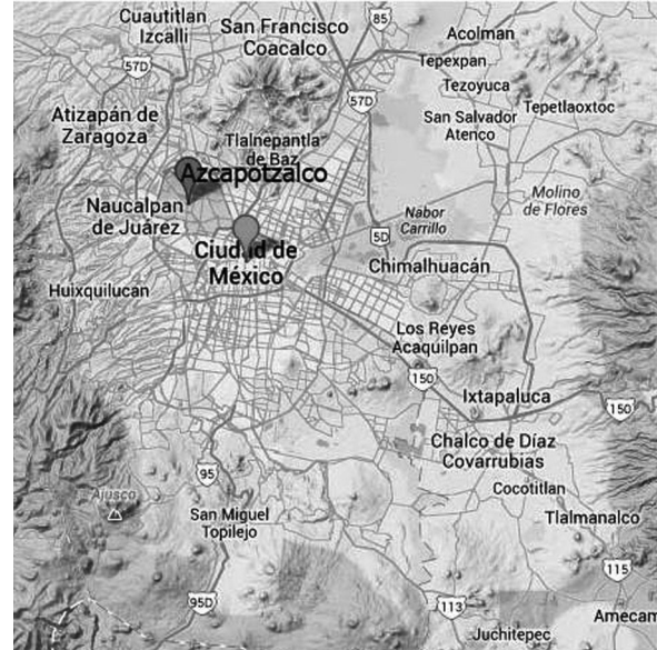
FIGURA 1. Azcapotzalco, una delegación del Distrito Federal, < https://maps.google.com/ >, 17 de enero de 2014.

Los productos de la industria modificaron su propia estructura, pues permitieron la automatización y a la vez la desindustrialización; ésta tuvo lugar en dos escalas: