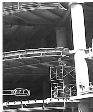
Obra.- Edificio Saint Regis. Paseo de la Reforma y Río Tiber, Colonia Cuauhtémoc, D.F.

(Fotografías. Arq. Alberto Ramírez Alférez)