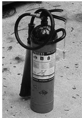
Extintor de dióxido de carbono (nieve carbónica).

Hay que señalar que los incendios son de diferente clase según los materiales que les dan origen y los alimenta.