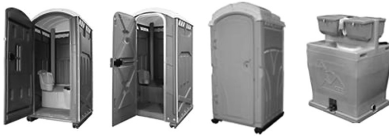
Sanitarios portátiles para la obra.

Delimitación de zonas: Demarcación con fines de seguridad y eficiencia de las áreas de maniobra de maquinaria pesada, de circulación horizontal, de transporte y de circulación vertical mediante señales y barreras. Es conveniente delimitar las diferentes zonas de la obra a fin de poder controlar su adecuada utilización por parte del personal y evitar los peligros que se derivan cuando no se toman tales precauciones.