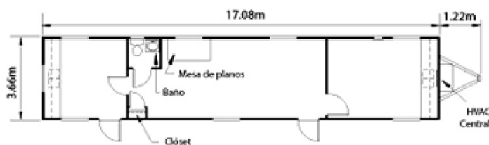
Oficina de campo móvil.