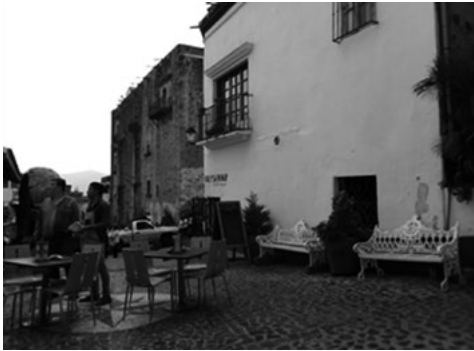
Figura 9. Plazuela del Bernal.

mercado internacional, para que vean que estamos a la altura... lo que importa es el turista, ese lugar era de nosotros, los que pasamos por ahí para subir a la casa" (ENT7-2019) (Figura 9).