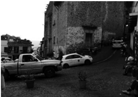
Figura 7. Rutas de primer y segundo orden.

Las rutas mencionadas, en segundo orden (Celso Muñoz, del Arco, de la Palma y de los Altos Redondo), son ramificaciones de las rutas principales, tienen configuración sinuosa con quiebres y cambios de relieve continuos; a lo largo de su trayectoria se encuentran, principalmente, plazuelas remetidas, bares, restaurantes, hoteles, tiendas de artesanía, talleres de plata y zonas de vivienda. En comparación con las rutas principales, éstas tienen menor tráfico vehicular, lo que no significa que disminuya la dificultad del peatón para caminar con libertad, sobre todo para los habitantes de los barrios contiguos cuando cierran las calles principales que circundan el Zócalo (Figura 7).