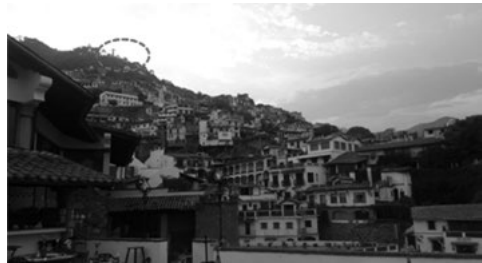
Figura 8. El Cristo Mirador.

O sea, la valoración del paisaje es el indicador de su elección, aunque se tenga que sortear un recorrido sinuoso cuesta arriba para llegar al sitio, pues es una ruta con pendiente accidentada y curvas cerradas, además, el asfalto se encuentra deteriorado por falta de mantenimiento; se han tenido varios accidentes, sobre todo en días festivos, pues su visita forma parte de las tradiciones del Cerro del Atache, que es ícono histórico.