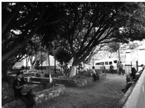
Figura 10. Parque Vicente Guerrero.

También es relevante comentar sobre la percepción de inseguridad o inseguridad real, ya que se trata de un problema social recurrente, no obstante, ante el intento de persuadir la visita del turista, los habitantes expresan sus miedos de manera prudente. Entre los puntos o rutas relacionadas con la sensación de inseguridad, por una parte, los entrevistados mencionan las calles y los callejones cuesta arriba y cuesta abajo, hacia al norte, al sur, al poniente y al oriente, o sea, en barrios o colonias ale-