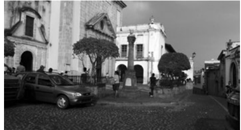
Figura 5. Ex convento de San Bernardino de Siena.

un intersticio urbano que está vinculado a un espacio abierto, ubicado en un quebrante de la calle principal (Benito Juárez), que conecta a la Plaza de los Arcos (Figura 5). El calificativo de “los arcos” se debe a los elementos arquitectónicos del vestíbulo de la plaza, ahí hay una entidad financiera donde se aglomeran los habitantes cuando reciben recursos provenientes de algún programa social; sin embargo, se ha convertido en un área insegura por la delincuencia que asalta a los beneficiarios. También hay varios locales comerciales de joyería, artesanía y ropa de marca nacional e internacional, así como restaurantes, bares y cafés, asimismo, la venta ambulante de alimentos y bebidas es común y los comerciantes se colocan en los arriates, las banquetas y los muretes de las jardineras.