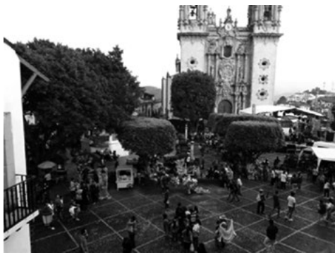
Figura 4. Zócalo y Santa Prisca.

las actividades de otros, asimismo, es común la venta de alimentos y bebidas por parte de vendedores locales, sumándose el comercio ambulante de artesanía que se instala en las banquetas, los pasillos y los callejones; 12 por la noche, la venta de alimentos se incrementa y la de artesanía disminuye (Figura 4). Se trata de un espacio-acción de uso cotidiano de los habitantes, debido a que “cada uno, por decisión propia o por designio de la vida y sus avatares, fija su posición” (Caneto, 2000: 25).