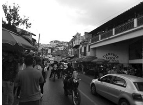
Figura 6. Ruta de primer orden.

Ahora bien, uno de los efectos del turismo ha sido el aumento del tráfico vehicular, sobre todo en fin de semana, con la llegada de personas en busca de actividades de ocio y recreación, lo que dificulta la afluencia y suscita la disputa por el espacio público entre el peatón y el automóvil (privado y público); las calles co-