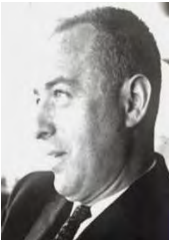
Pie de foto 3: Oscar Lewis.