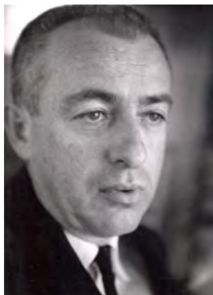
Pie de foto 2: Oscar Lewis.

Lewis no se inclinó por ninguna corriente de forma absoluta, ni se puede decir que haya sido discípulo fiel de alguno de ellos, pero se apoyó en muchas de las tesis, principalmente en la de Ruth Benedict, quien también le proporcionó a todos los estudiantes norteamericanos que necesitó, primero para su proyecto de tesis doctoral en Columbia, que consistió en el estudio de la tribu de Pies negros de Estados Unidos y Canadá y el contacto de ésta con los blancos. 36