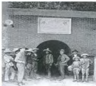
EL SOCAVÓN, 1910

de otras épocas, ya que son testimonio del quehacer humano. Un ejemplo de lo anterior es la entrada al socavón en el Museo.