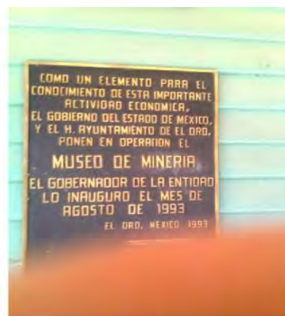
PLACA INAUGURAL DEL MUSEO

La propuesta museográfica del Dos Estrellas busca hacer una breve narración histórica y una descripción de las exhibiciones de objetos por tipos de colecciones, contenidos temáticos, y secuencias cronológicas. Como señala Morales Moreno: “el museo no únicamente transfigura o distorsiona, sino que también censura, excluye, selecciona la memoria colectiva. Así, por ejemplo, los catálogos del museo ordenan, la memoria y el olvido en el espacio de la memoria misma”. El guión museográfico es didáctico y comprensible, dirigido al gran público, y relaciona al paisaje con el patrimonio industrial (edificios y objetos), y busca que se traduzca en un proyecto expositivo claro, moderno y de calidad.