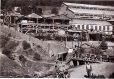
Antiguas instalaciones de la Mina