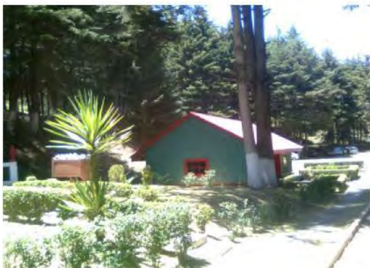
UNA DE LAS SALAS DEL MUSEO DE EL ORO

Con la puesta en funcionamiento del Museo Dos Estrellas, el paisaje de la Somera se transformó a partir de 1999, sobre todo la zona ecológica que ahora se recrea por la intervención artística. El proyecto museográfico ha incidido en la potenciación de itinerarios turísticos y en el impulso de reconstrucciones urbanísticas y/o arquitectónicas en su zona de influencia y más allá de él, como es el caso de El Oro, Estado de México, donde existe desde 1993 otro museo minero.