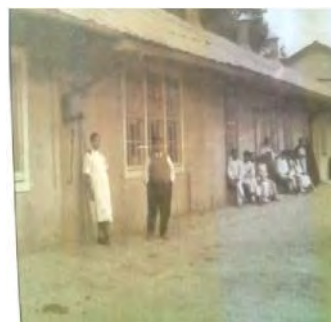
EL HOSPITAL DE LA MINA

La antropología simbólica también ofrece posibilidades abiertas de significados del pasado y de las imágenes y sus procesos de producción y conocimiento para explicar su significado. En el Museo Dos Estrellas está presente el universo del discurso humano, y aunque ésta no es su finalidad al aspirar a la instrucción, entretenimiento y a la reflexión histórica, con todo ello contribuye al progreso ético de la comunidad y descubrir las diversas condiciones de los hombres. 106