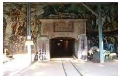
EL SOCAVÓN, 2010

La Carta de Cracovia de 2000, por ejemplo, señala que “el mantenimiento y la restauración son una parte fundamental del proceso de conservación del Patrimonio. Estas acciones tienen que ser organizadas con una investigación sistemática, inspección, control, seguimiento y pruebas. Hay que informar y prever el posible deterioro y tomar las adecuadas medidas preventivas”.