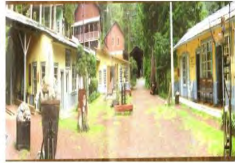
Museo Minero Dos Estrellas

El Museo Tecnológico Minero del Siglo XIX Dos Estrellas es una institución pública que desempeña una función didáctica no lucrativa para la comunidad a la que pertenece. Es una entidad con objetivos y funciones específicas para su desempeño, los cuales giran en torno al conocimiento de la historia de la cultura minera del lugar.