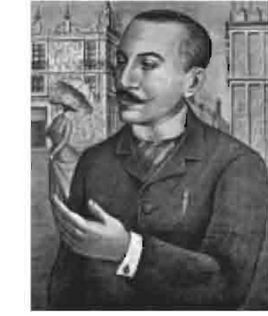
Manuel Gutiérrez Najera (1859-1895)