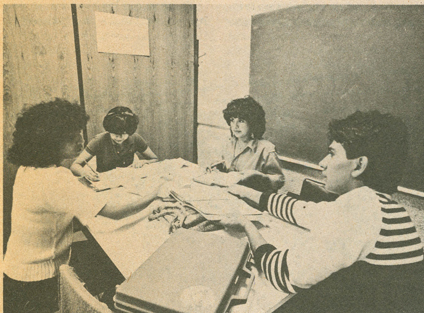
Hay una gran diversidad de proyectos en servicio social

Pronto se tendrá un fuerte desarrollo de posgrados, como la maestría mencionada, y un curso especializado en empresas públicas. Además, en cuanto a la investigación que se ha hecho en los últimos años y los esfuerzos en cuanto a nivel de desarrollo de la docencia, han habido resultados que están a la vista: la División empieza a generar opinión en el conjunto del medio académico y de la sociedad en general.