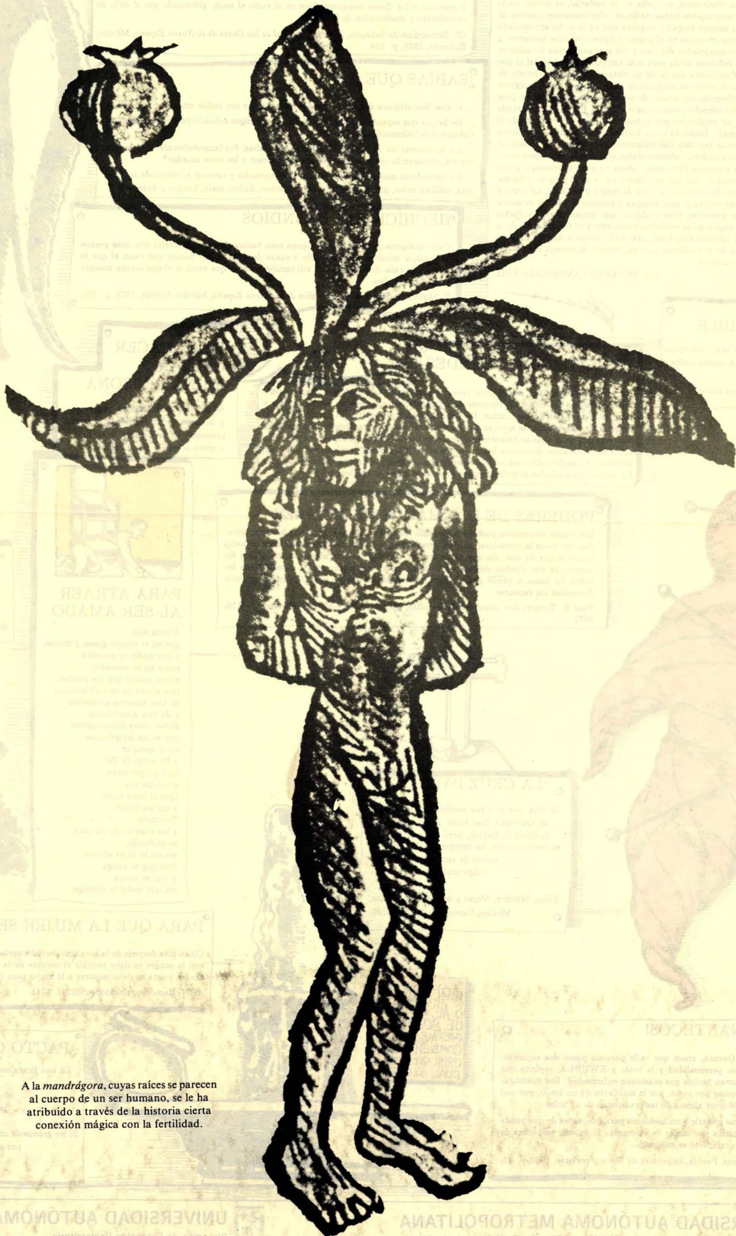
A la mandrágora, cuyas raíces se parecen al cuerpo de un ser humano, se le ha atribuido a través de la historia cierta conexión mágica con la fertilidad.

HISTORIADOR POPULAR México - Querétaro, Año 1. Segunda Epoca, No. 8 Junio de 1988