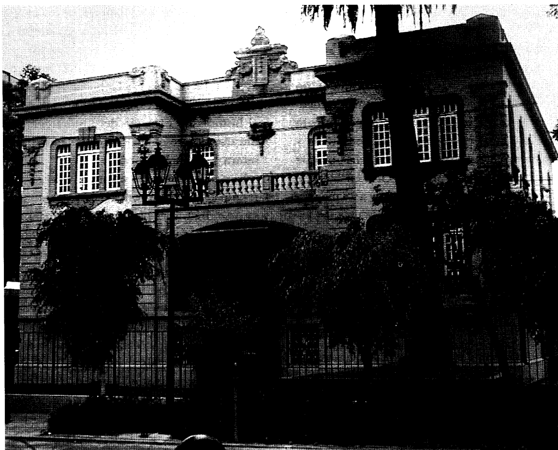
Casa de Francia.

estados podía apasionarse tanto al estudiar algo que lo hacia suyo.