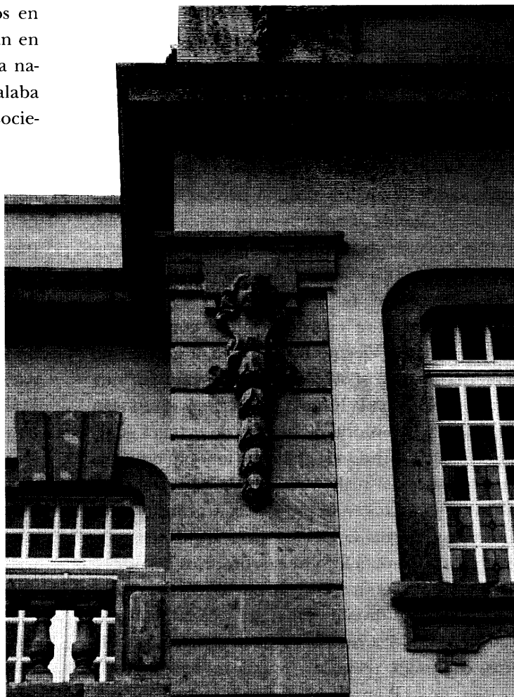
Casa de Francia.